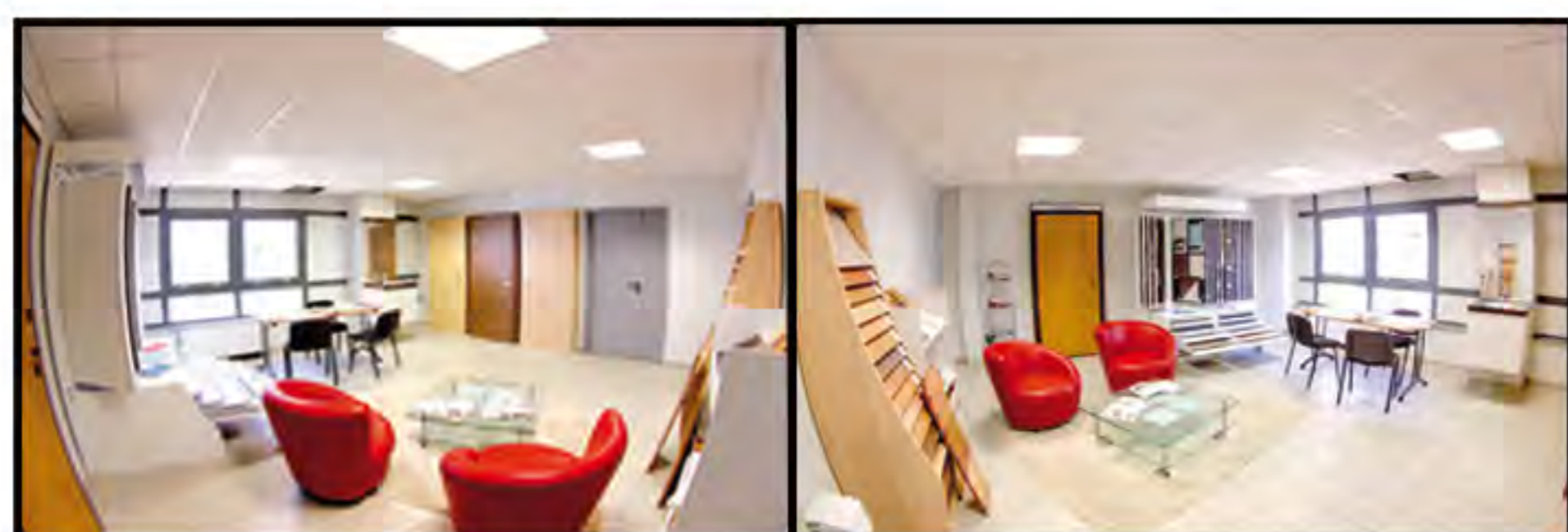
La salle de choix des finitions de votre appartement